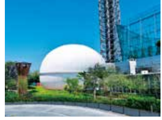
多摩六都科学館外観

【アクセス】西東京市芝久保町5-10-64 TEL042-469-6100 バス:田無駅北口 はなバス「第4北ルート」花小金井駅行「多摩六都科学館」下車 ひばりが丘駅南口 西武バス「田44」田無駅行「西原グリーンハイツ」下車徒歩10分