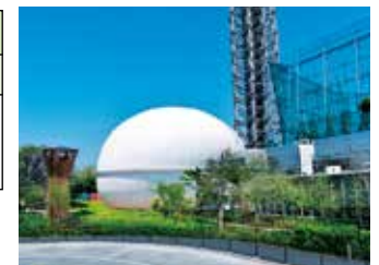
多摩六都科学館外観

【アクセス】西東京市芝久保町5-10-64 TEL042-469-6100 バス: 田無駅北口 はなバス「第4北ルート」花小金井駅行「多摩六都科学館」下車 ひばりが丘駅南口 西武バス「田44」田無駅行「西原グリーンハイツ」下車徒歩10分