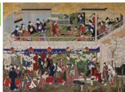
喜多川歌麿《吉原の花》寛政5年(1793)頃 ワズワース・アテネウム美術館 Wadsworth Atheneum Museum of Art, Hartford. The Ella Gallup Sumner and Mary Catlin Sumner Collection Fund

※大学生、高校生チケットは当センターでの取扱いはありません。現地でお買い求めください。