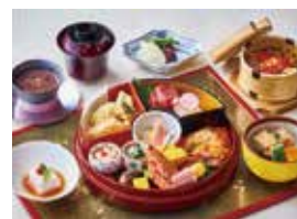
日本料理「花むさし」イメージ

有効期限：令和7年1月31日まで 除外日：12/21~12/25、1/1~1/5