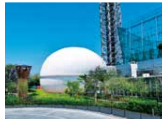
多摩六都科学館外観

【アクセス】西東京市芝久保町5-10-64 TEL042-469-6100 バス：田無駅北口 はなバス「第4北ルート」花小金井駅行「多摩六都科学館」下車 ひばりが丘駅南口 西武バス「田44」田無駅行「西原グリーンハイツ」下車徒歩10分