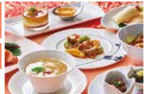
中国料理「桂林」イメージ

☆料金にはサービス料消費税が含まれています。 1会員5枚まで ☆ご利用の際には、ご予約をお願いいたします。 食事券の利用があることを伝え、利用時に食事券をご提出ください。 ☆土日祝、イベント開催日は時間制となります。