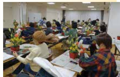
※令和5年度の会場風景

10月1日(火)よりサービスセンターの営業時間は 9:00～16:00となります。